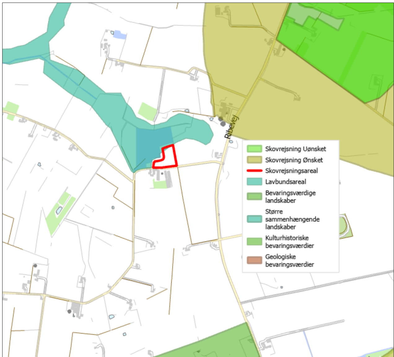
Figur 2. Anlæggets placering i landskabet.

Projektet ligger delvist inden for, i Kommuneplanen 2021, udpeget lavbundsareal. Vejen Kommune vurderer, at skovrejsning i området ikke vil forhindre at det naturlige vandstands niveau kan genskabes.